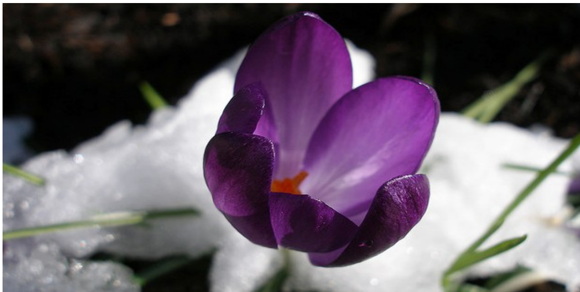
Maart roert zijn staart

Hoewel we snakken naar de lente, kan er in maart nog van alles gebeuren. Maart roert zijn staart is niet voor niets het gezegde. Daarom reiken we u in deze nieuwsbrief een aantal websitetips aan. Mocht het toch nog te koud zijn deze maand, dan kunt u binnen lekker warm aan de slag met de SimPC.